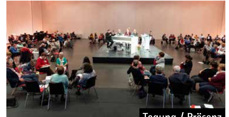
Tagung / Präsenz

Tagung / Präsenz Von (Mit)Beteiligung und (Mit)Verantwortung Freitag/Samstag, 30. Juni – 1. Juli 2023